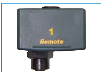
Abnehmbarer Remoteadapter mit RJ-45- und geschirmter M12-Koaxialbuchse

Kompaktes, ergonomisches Design zum vollständigen Testen von Industrial Ethernet-Kabeln