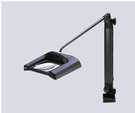
SNL 319 A