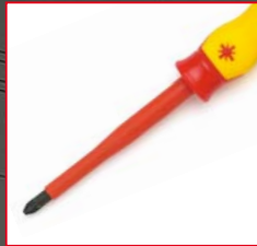
⊛ Pozidriv PZ080, PZ110, PZ210, PZ315

Schraubendreher für jeden Einsatz – auch im Set