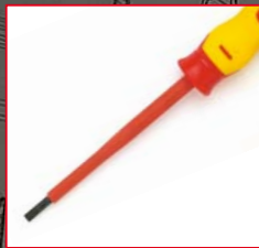
⊖ Schlitz SL25, SL40, SL65