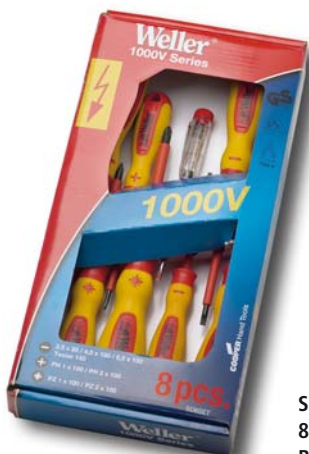
Schraubendreher Set 8-teilig Bestell-Nr. SD8SET