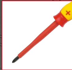
⊕ Phillips® PH080, PH110, PH210, PH315