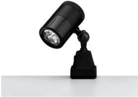
SPOT LED 003 - MCXFL 3 S