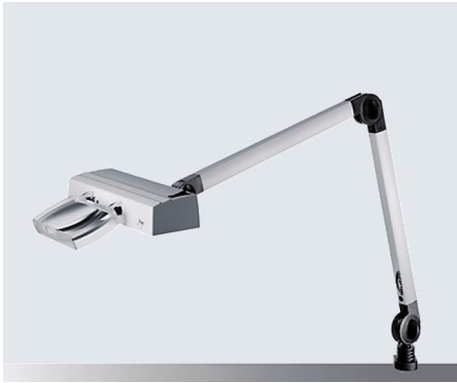
ARGUS - ARG 111