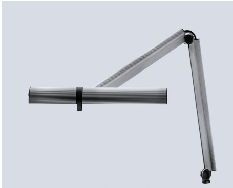
diva 910 - PTE 111