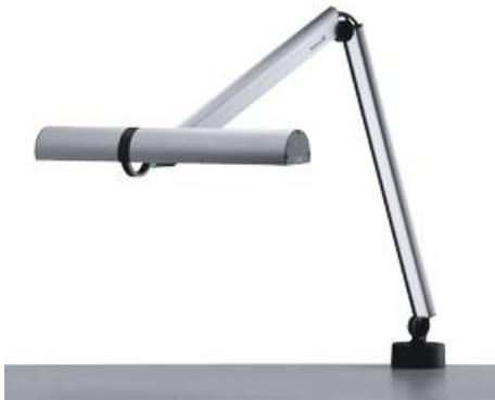
diva 900 - PTLE 4